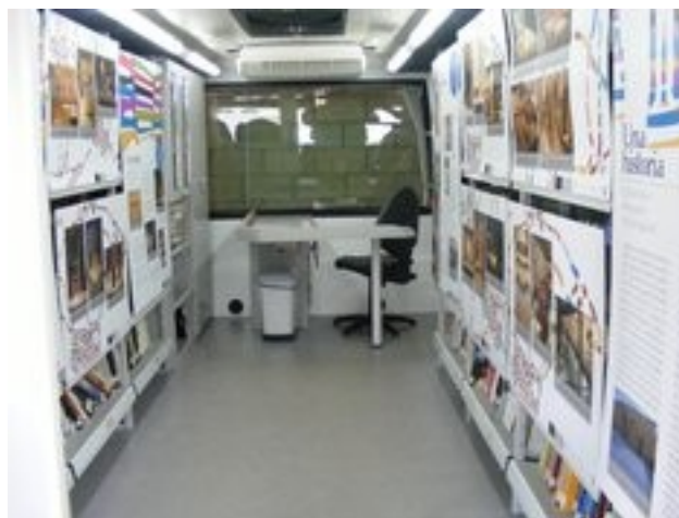
Bibliobus - Museo etnográfico