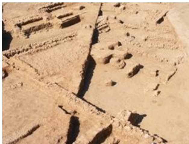
Yacimiento romano de Puente Castro