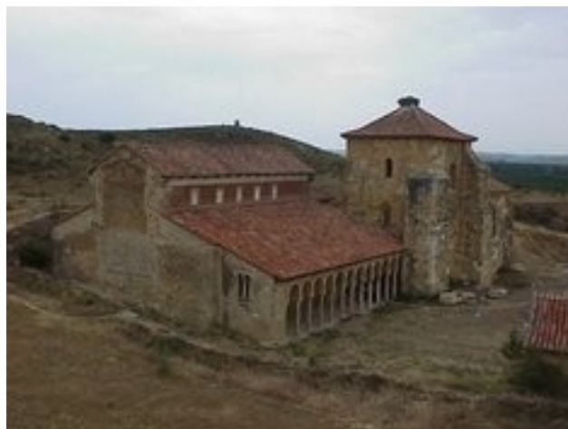
San Miguel de Escalada