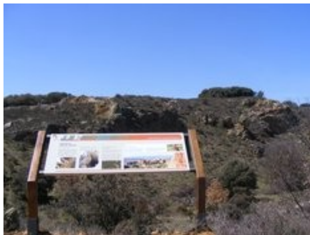
Ruta turística cultural en Val de San Lorenzo