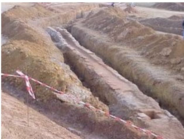
Acueducto romano de León