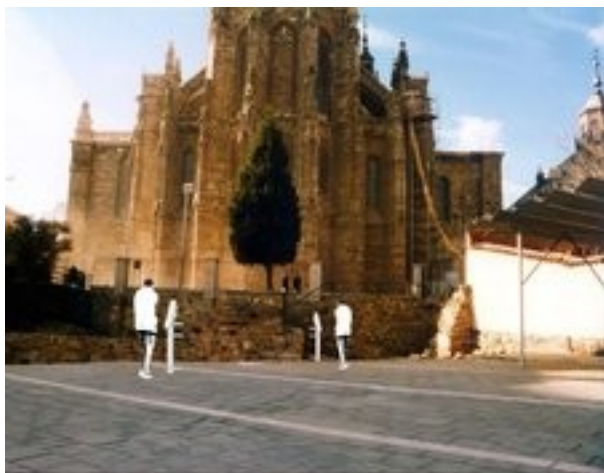
Puesta en valor Puerta Romana de Astorga

Nuestra experiencia en este ámbito viene dada por la propia formación de nuestro personal, así como la continua asistencia a reuniones y seminarios que nos permiten conocer las últimas tendencias en materiales y formas expositivas.