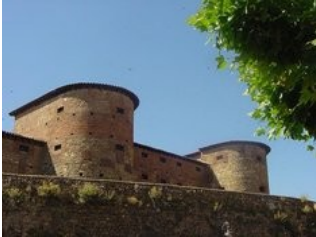
Murallas de León

Nuestra tarea consiste en la documentación histórico-arqueológica de edificios que van a ser, o están siendo restaurados, con el fin de mejorar el conocimiento de las fases de los mismos, así como de la evolución de los materiales y las fábricas.