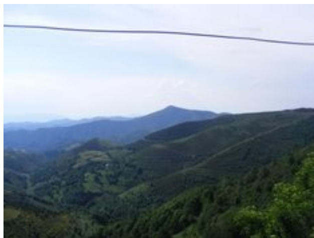
Parque eólico entre León y Orense