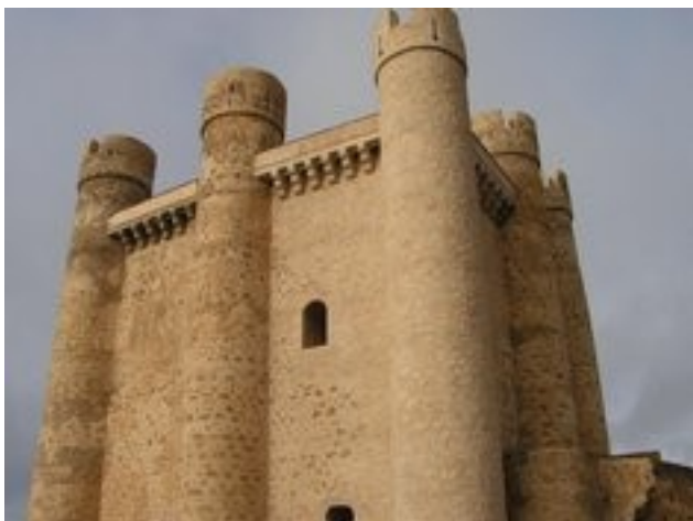
Castillo de Valencia de Don Juan

Con mas de un centenar de intervenciones, son la principal actividad de nuestra empresa, desde 1997. Las excavaciones arqueológicas tienen por objeto documentar las evidencias del pasado y así permitir el conocimiento del mismo.