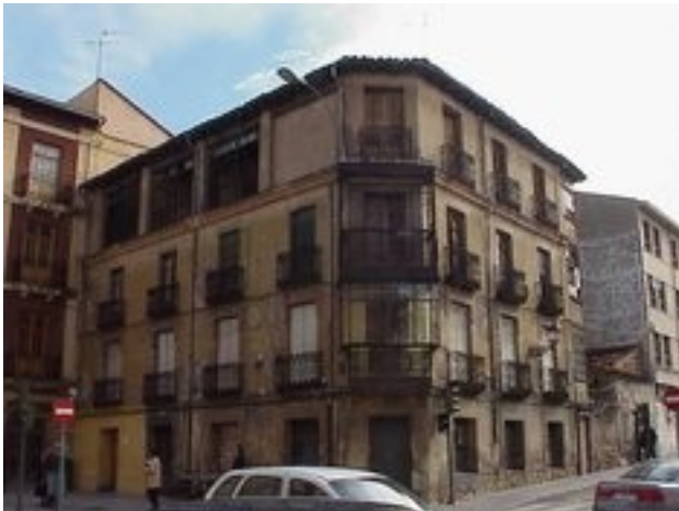
C/ Abadía c/v Ramón y Cajal, en León