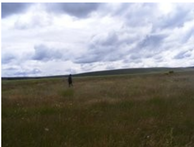
Explotaciones mineras en norte de Zamora