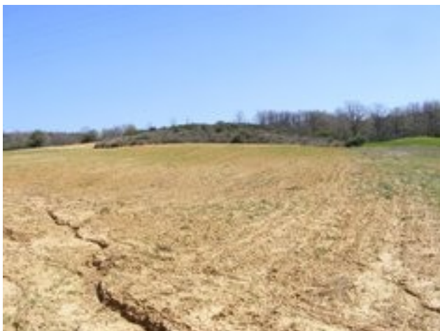
Normas urbanísticas en Villazanzo de Valderaduey

Las prospecciones tienen como objeto localizar yacimientos o bienes etnográficos. Hemos realizado prospecciones para modificaciones de normas urbanísticas , para explotaciones mineras , y para la instalación de parques eólicos .