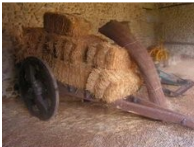
Colección museográfica de Carracedelo