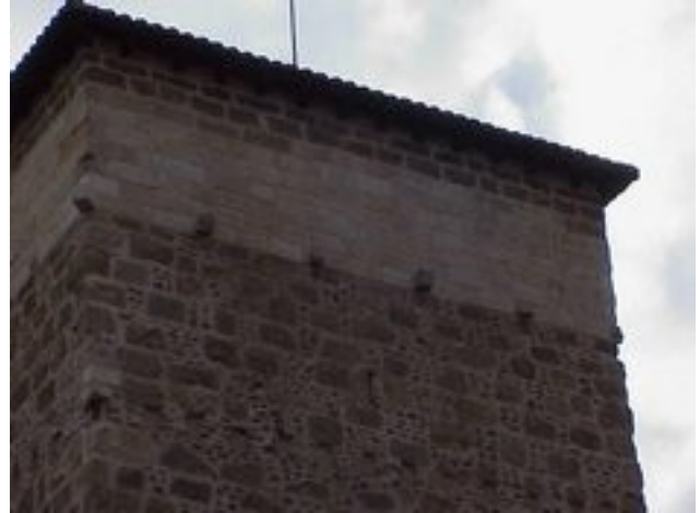
Torre de los Ponce