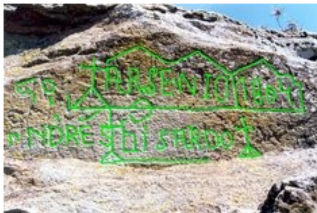
Explotación minera en Lucillo