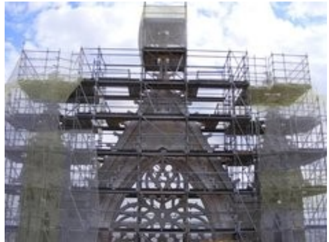
Fachada sur de la Catedral de León